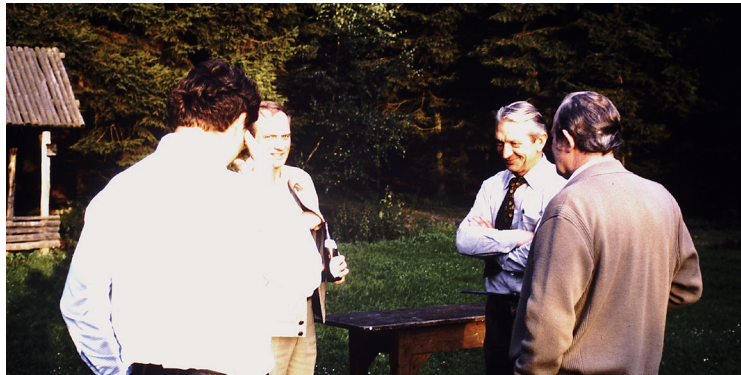
Erntedankfest 1981 an der Scherfeder Waldhütte