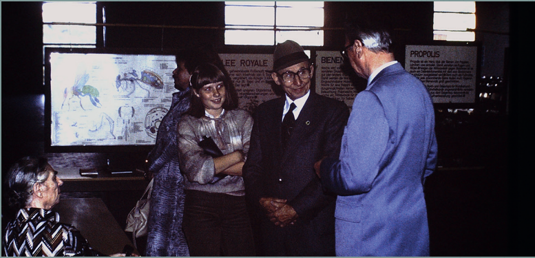
Fachgespräch bei der Ausstellung