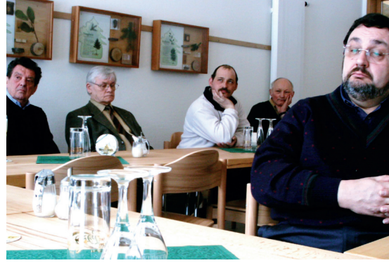
Scherfeder Imker bei der Besprechung am Hammerhof