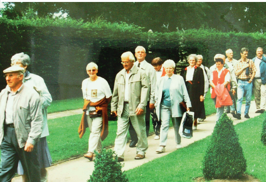
Stadtführung in Würzburg und Besuch des Instituts in Veitshöchheim

Im Jahr 2000 machte der Imkerverein anlässlich der 1175-Jahr-Feier Scherfedes auf sein 80-jähriges Bestehen aufmerksam. Gefeiert wurde das Jubiläum aber nur vereinsintern im Rahmen des Erntedankfestes in der Waldhütte.