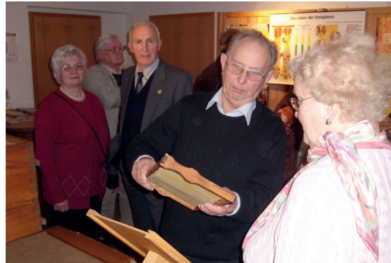
Impressionen der Ausstellung und Pressebericht

Hinsichtlich des gewünschten Nachwuchses änderten diese Aktivitäten zunächst leider nichts. So überschritt das Durchschnittsalter der Mitglieder die Marke von 65 Jahren und die Zahl der 2010 dem Landesverband gemeldeten Mitglieder schrumpfte auf 24, die nur noch 125 Völker bewirtschafteten.