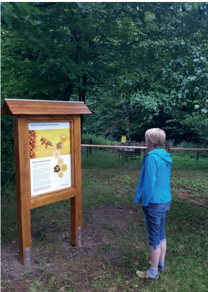
Informationstafel im Wildpark Willebadessen

Zeitungsausschnitt des Berichts über die Eröffnung des Bienenstandes