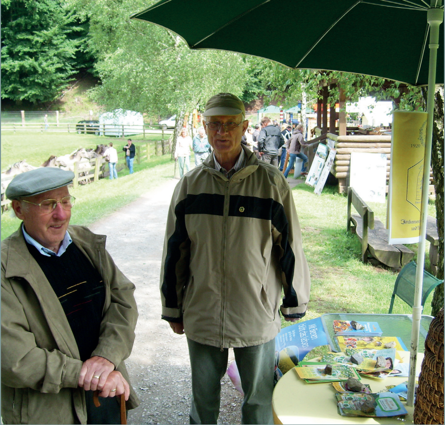
Infostand beim „Wisentfest“