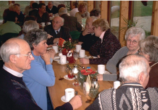
Erstes Adventskaffeetrinken im Hammerhof-Café

Um jüngere Menschen anzusprechen, startete der Imkerverein 2007 mit seinem Internetauftritt und der noch heute gültigen Adresse: