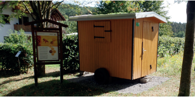
Der Bienenwagen am Blühfeld des Hammerhofes

tiger Hingucker gemacht werden und er schmückt nun den Zuweg zum Hammerhof. Eingeweiht wurde er im Juni parallel zum „Kleinen Wildpferdfest“.