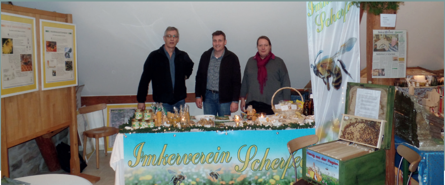
Imkerstand beim Sommerfest und beim Adventsmarkt